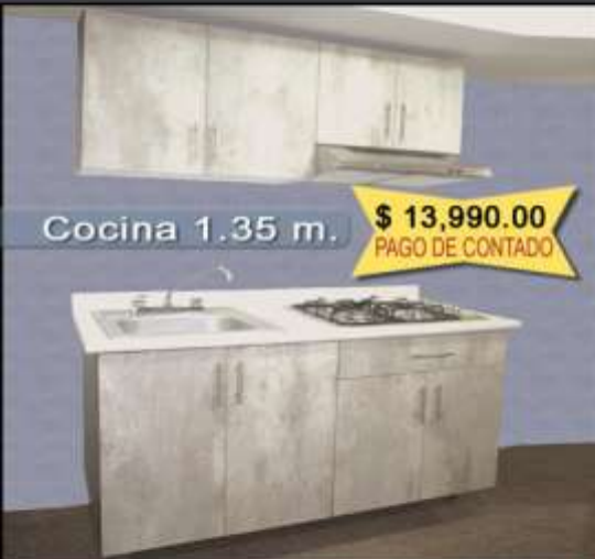
Cocina 1.35 m.

" Nos adaptamos a su gusto, estilo y presupuesto "