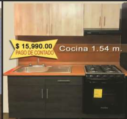
Cocina 1.54 m.