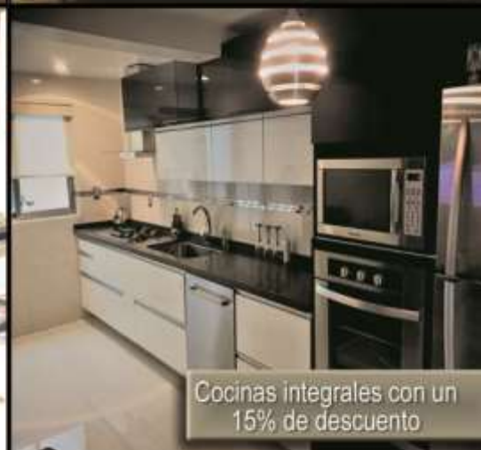
Cocinas integrales con un 15% de descuento

Los precios incluye: Equipo completo, flete y colocación en el area metropolitana.