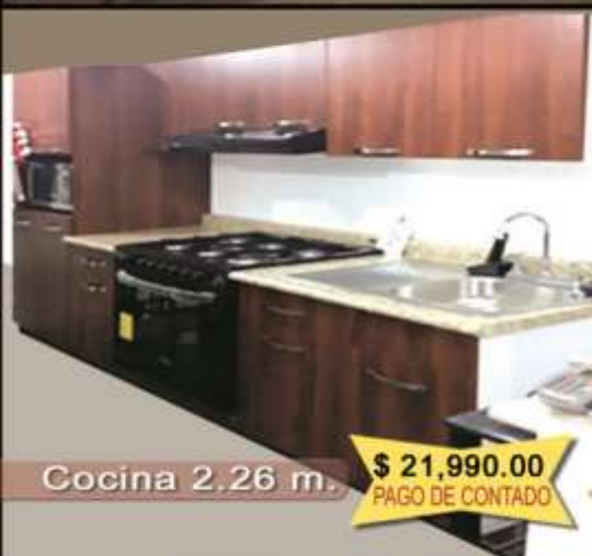
Cocina 2.26 m.