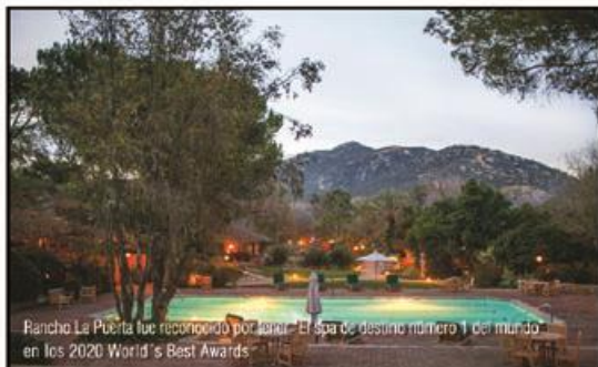
Rancho La Puerta fue reconocido por tener "El spa de destino número 1 del mundo" en los 2020 World's Best Awards

Actualmente Rancho La Puerta se encuentra cerrado, pero preparan su reapertura implementado protocolos adicionales de limpieza y desinfección, además de trabajar de la mano de las indicaciones sobre seguridad en viajes de las administraciones de Estados Unidos y México.