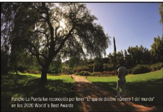
Rancho La Puerta fue reconocido por tener "El spa de destino número 1 del mundo" en los 2020 World's Best Awards