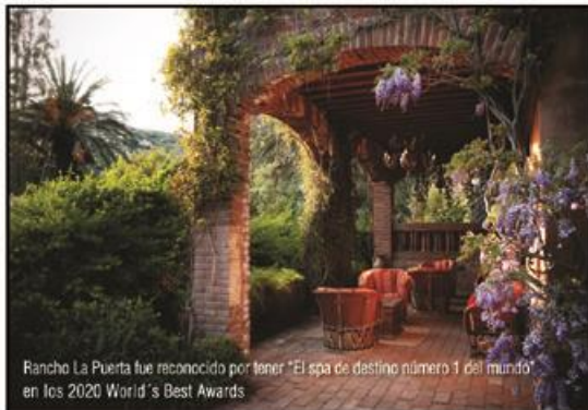
Rancho La Puerta fue reconocido por tener "El spa de destino número 1 del mundo" en los 2020 World's Best Awards

Baja California se ha convertido en uno de los destinos favoritos gracias a su magnífica gastronomía, experiencias auténticas con los mejores vinos y cervezas artesanales del país, así como naturaleza muy variada que permite a cualquiera aventurarse a todo tipo de actividades, pero el sector Wellness es uno de sus tópicos más destacados, que año con año es muy solicitado por turistas nacionales e internacionales.