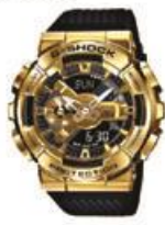
G-shock Gma-b800sc-1a4cr- Jack, el hombre calabaza