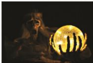
G-shock Youth Gm-110g-1a9cr- Calacas

Este Halloween Casio te recomienda: Si quieres alejar a los monstruos más temibles de la temporada, NO uses los siguientes relojes: