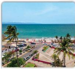
Paradise Village Marina