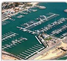
Marina Riviera Nayarit

J70 & Clase Oceánica: El poder de las embarcaciones de quilla y la estrategia de altura.